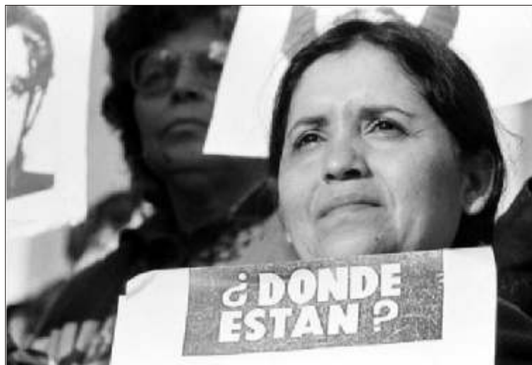
Una della madri di Plaza de Mayo

Il Museo è stato voluto dall'Amministrazione comunale anche per restituire alla piazza, intesa come luogo storico, il ruolo importante di coesione della cittadinanza già in passato rivestito.