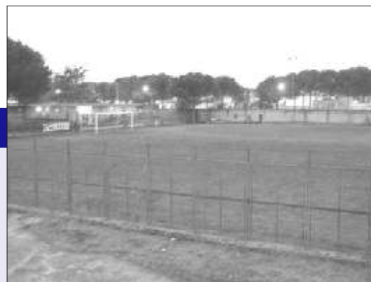
Lo stadio di Cardito