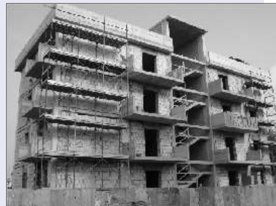
Gli alloggi di via Pirandello

esigenze abitative dei numerosi nuclei familiari di Brusciano, l'assegnazione in locazione di questi alloggi, nel quartiere 219 permetterà ad alcune famiglie che vivono in condizioni economiche e sociali precarie di avere finalmente una casa dignitosa".