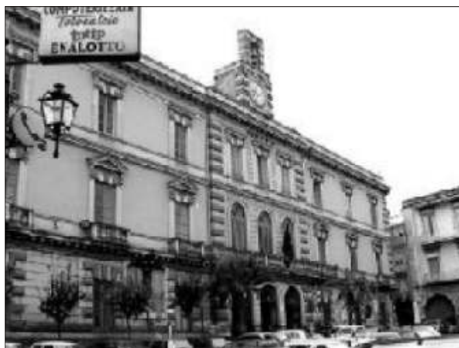
Il Comune di Afragola

In ultimo la decisione del Consiglio dei Ministri che ha proposto al Presidente della Repubblica lo scioglimento del Consiglio Comunale con la nomina della Commissione Straordinaria che sarà per diciotto mesi al governo della città.