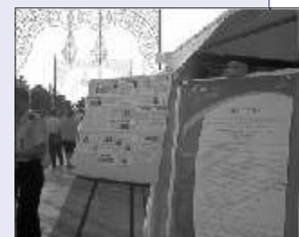
Lo stand del Creco